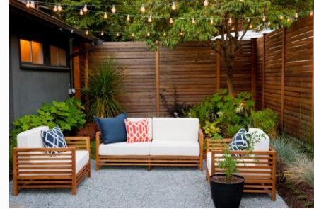
Outdoor Area Inspiration (Sunken Patio)